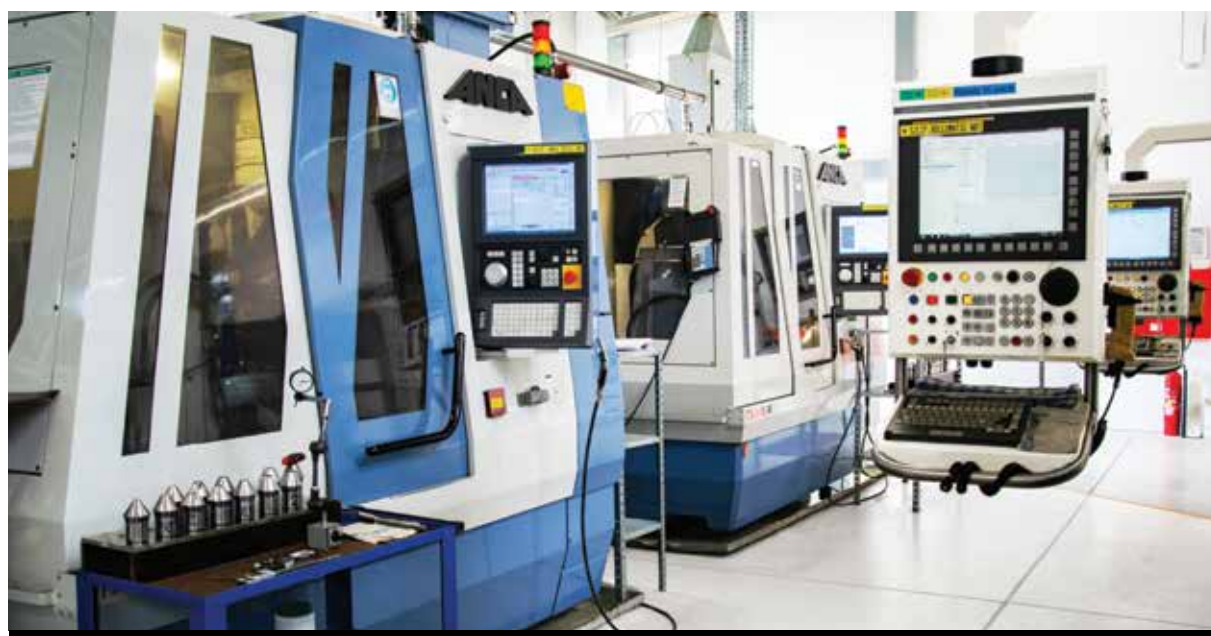
Firma dokłada wszelkich starań dla zachowania jak najwyższej jakości produkowanych narzędzi oraz ciągle rozwija swoją ofertę.