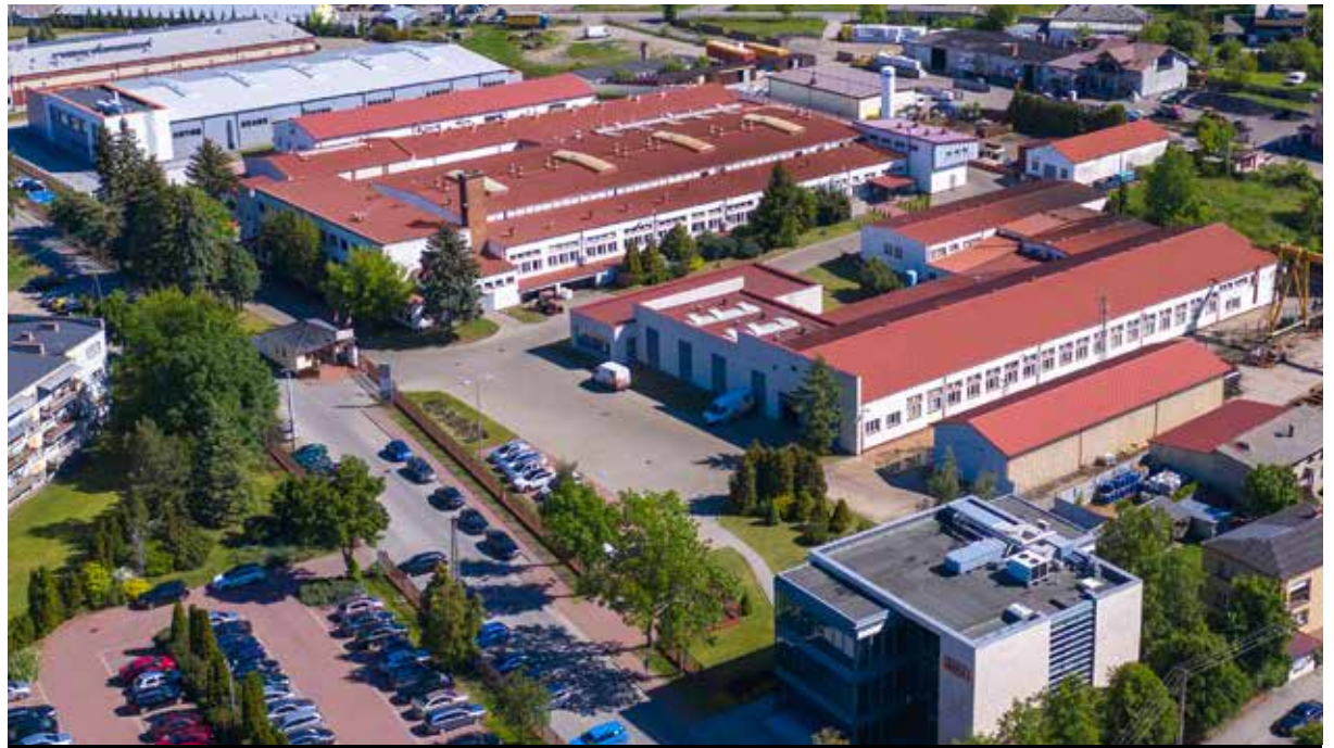
Zakład i siedziba FABA S.A. znajdują się w Baboszewie, niedaleko Warszawy.

To nowoczesne rozwiązanie wykorzystuje inteligentną automatyzację i integrację IT do łączenia procesów oraz systemów produkcji narzędzi. Zaawansowane oprogramowanie do zarządzania procesem szlifowania umożliwia użytkownikom monitorowanie i optymalizowanie procesów szlifowania, aby uzyskać najwyższą jakość produktu przy minimalnych kosztach. Proces produkcji jest maksymalnie zautomatyzowany, od przenoszenia narzędzi między operacjami za pomocą robota do w pełni zautomatyzowanego pomiaru narzędzi i kompensacji procesu oraz zarządzania danymi. AIMS zapewnia usprawnioną produkcję z połączonymi procesami produkcji narzędzi zintegrowanymi z systemami informacyjnymi, które przenoszą produkcję